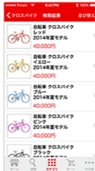
検索の商品 一覧画面